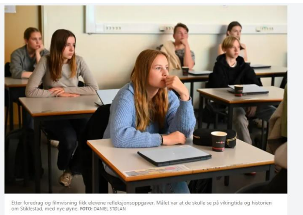
Etter foredrag og filmvisning fikk elevene refleksjonsoppgaver. Målet var at de skulle se på vikingtida og historien om Stiklestad, med nye øyne.

Linnea 9. trinn: «Synes Sigrid-prosjektet var veldig bra, lærte mye som jeg ikke visste fra før. Jeg syntes det var veldig interessant å vite hvordan damene hadde det i vikingetiden. Det er stor forskjell på hvordan vi har det i dag».